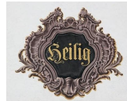
Heilig und geistvoll

In den Briefen von Paulus an die jungen christlichen Gemeinden wird das sinngemäß so zum Ausdruck gebracht: „Der Heilige Geist verleiht den Glaubenden verschiedene Gaben, die zur Erbauung der Gemeinde dienen“ (1. Korinther 12,4 - 11).